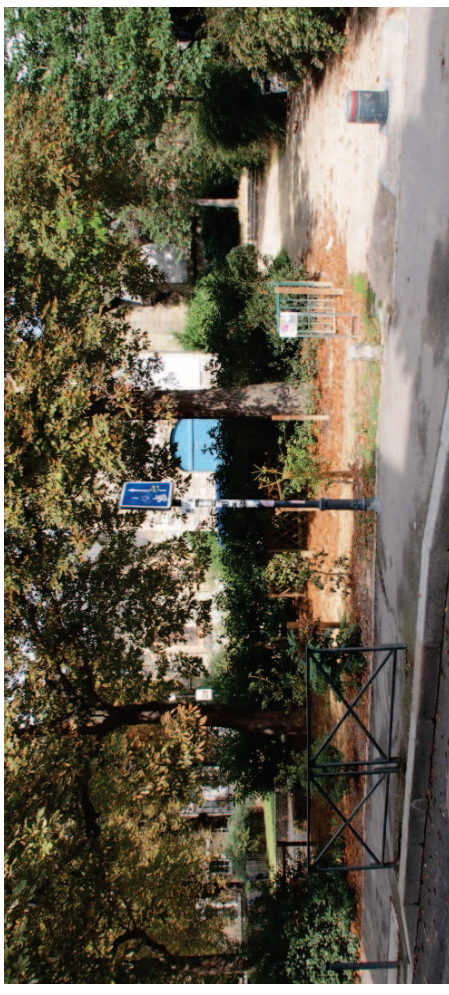
Photos de la façade Sud Prises depuis la rue d'Echange